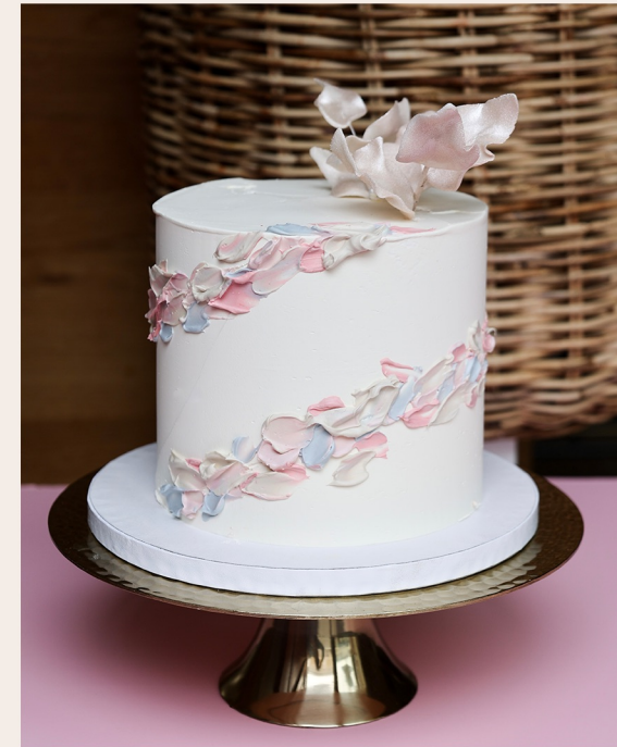
Beispieltorte: 8 Stück, Ø 15cm, Höhe ca. 12cm

1 STOCKWERK 2 STOCKWERKE WEITERES ab 116,00 € ab 280,00 € auf Anfrage