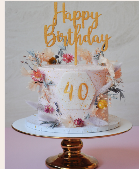
8 Stück Torte mit Zahlenschild und Cake Topper