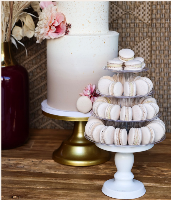
Macarontower: 4 Etagen ca. 40 Stück