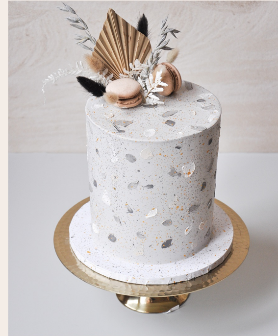
Beispieltorte: 14 Stück, Ø15cm, ca 18cm hoch