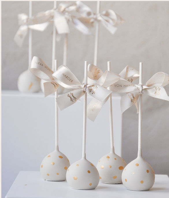
Cake Pops mit Schleife