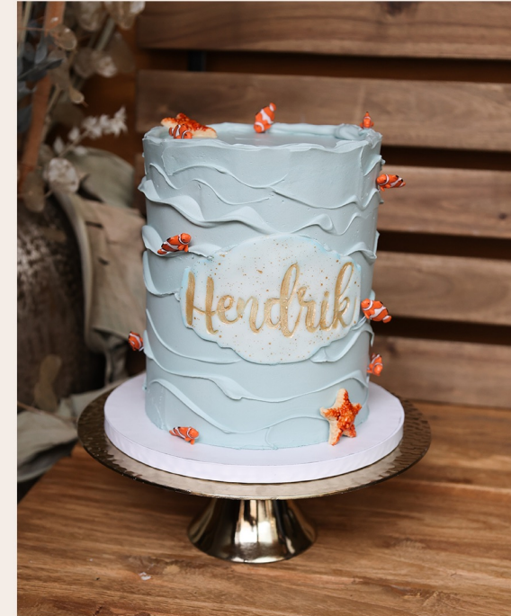
Beispieltorte: 14 Stück, Ø 15 cm, ca. 18cm Höhe

1 STOCKWERK 2 STOCKWERKE WEITERES ab 130,00 € ab 297,00 € auf Anfrage