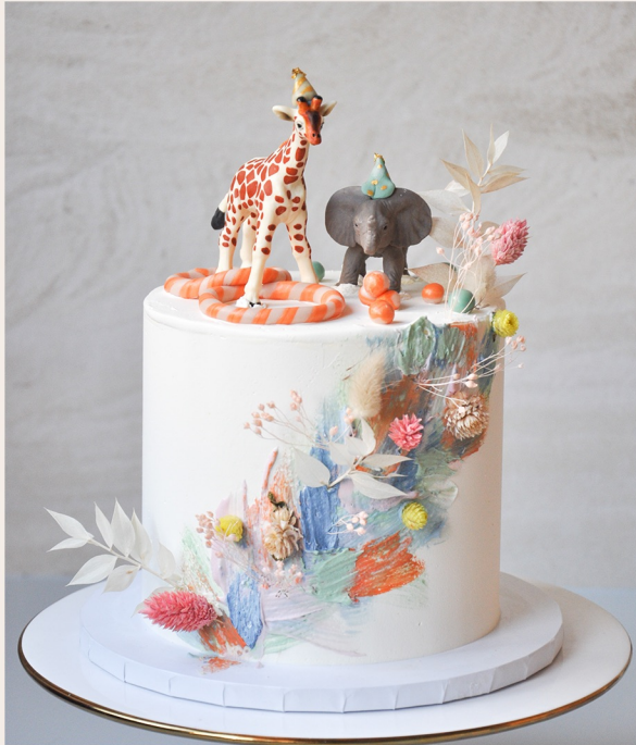
Beispieltorte: 8 Stück, Ø 15 cm, ca. 12cm Höhe ohne Deko

1 STOCKWERK 2 STOCKWERKE WEITERES ab 150,00 € ab 317,00 € auf Anfrage