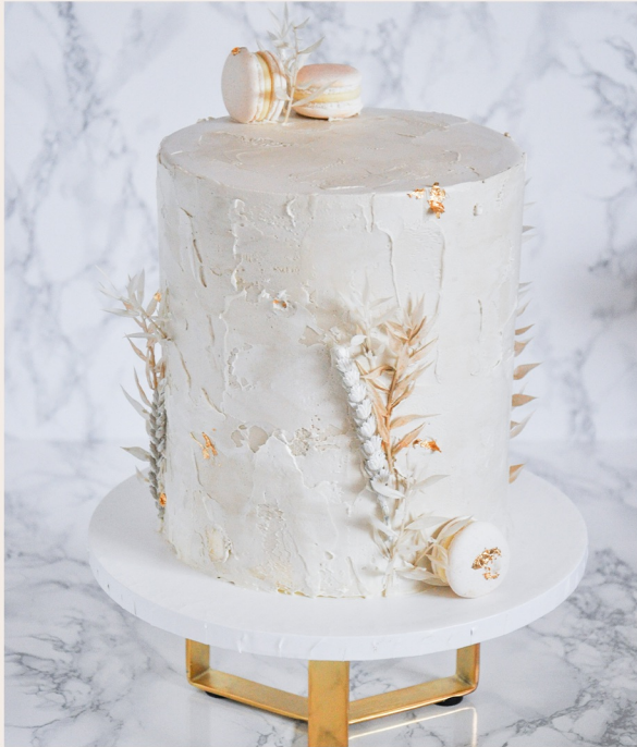
Beispieltorte: 18 Stück, Ø 17cm, Höhe ca. 18cm

1 STOCKWERK 2 STOCKWERKE WEITERES ab 121,00 € ab 282,00 € auf Anfrage