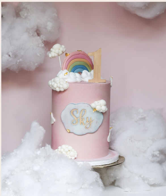
14 Stück, Ø 15 cm, ca. 18cm Höhe ohne Deko

1 STOCKWERK 2 STOCKWERKE WEITERES ab 146,00 € ab 301,00 € auf Anfrage