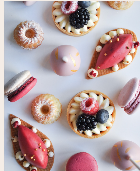
Mini Patisserie: Thema Waldbeere