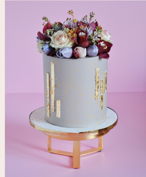
Beispiektorte: 18 Stück, Ø 17cm, Höhe ca. 18cm

1 STOCKWERK 2 STOCKWERKE WEITERES ab 140,00 € ab 292,00 € auf Anfrage