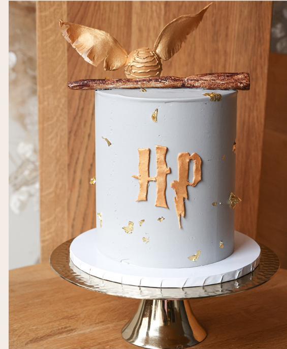
Beispieltorte: 14 Stück, Ø 15 cm, ca. 18cm Höhe

1 STOCKWERK 2 STOCKWERKE WEITERES ab 143,00 € ab 301,00 € auf Anfrage