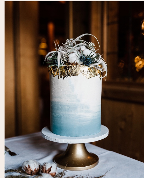
Beispieltorte: 14 Stück, Ø 15cm, Höhe ca. 18cm

1 STOCKWERK 2 STOCKWERKE WEITERE ab 153,00 € ab 311,00 € auf Anfrage