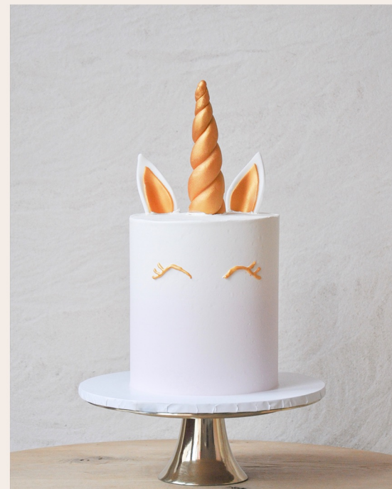
Beispieltorte: 14 Stück, Ø15cm, ca 18cm hoch ohne Horn

1 STOCKWERK 2 STOCKWERKE WEITERES ab 133,00 € ab 297,00 € auf Anfrage