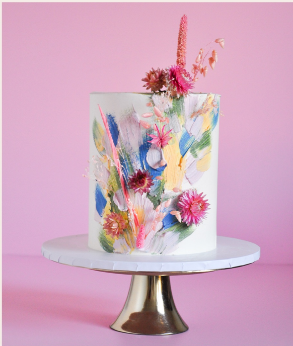
Beispieltorte: 14 Stück, Ø 15cm, Höhe ca. 18cm

1 STOCKWERK 2 STOCKWERKE WEITERES ab 121,00 € ab 282,00 € auf Anfrage