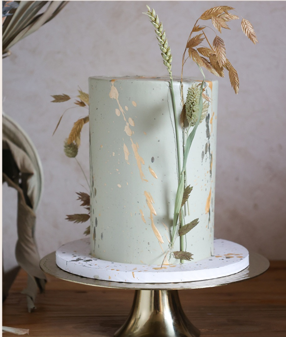
Beispieltorte: 14 Stück, Ø 15cm, Höhe ca. 18cm