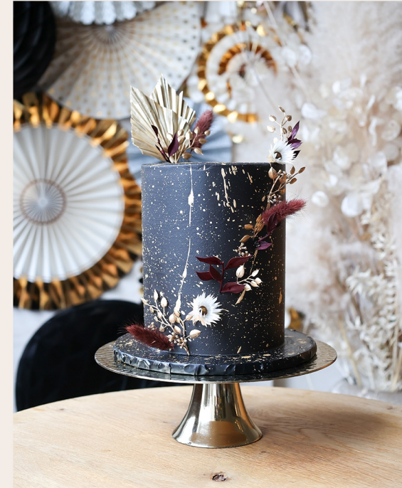
Beispieltorte: 14 Stück, Ø 15cm, Höhe ca. 18cm

1 STOCKWERK 2 STOCKWERKE WEITERES ab 129,00 € ab 296,00 € auf Anfrage