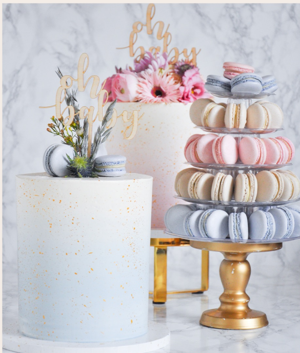
Beispieltorte: 14 Stück, Ø15cm, ca 18cm hoch, exkl. Topper

1 STOCKWERK 2 STOCKWERKE WEITERES ab 123,00 € 288,00 € auf Anfrage