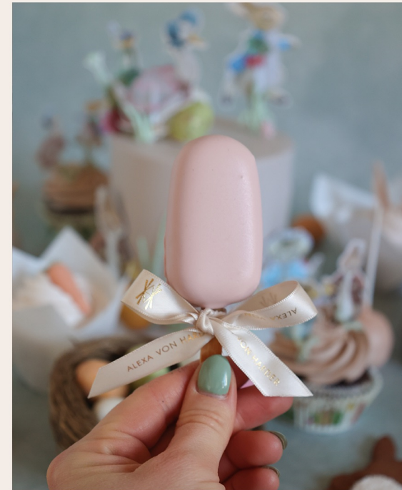
Cake Sicle klein