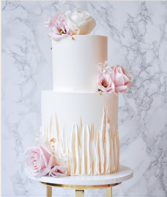
Beispiektorte: 20 Stück, Ø 15cm, Ø 11cm

1 STOCKWERK 2 STOCKWERKE WEITERES ab 119,00 € ab 274,00 € auf Anfrage