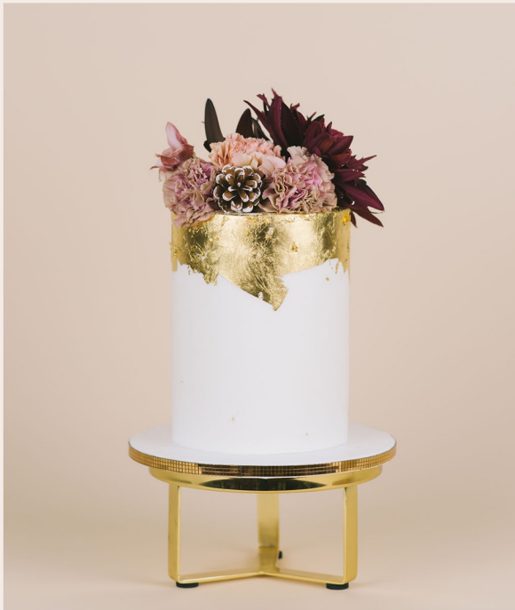
Beispieltorte: 14 Stück, Ø 15cm, Höhe ca. 18cm

1 STOCKWERK 2 STOCKWERKE WEITERES ab 145,00 € ab 297,00 € auf Anfrage