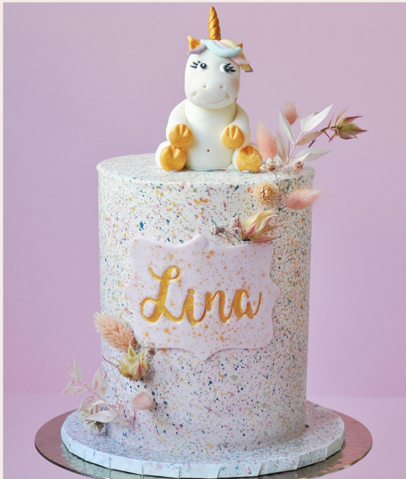
14 Stück Torte mit Namensschild und handgefertigter Figur