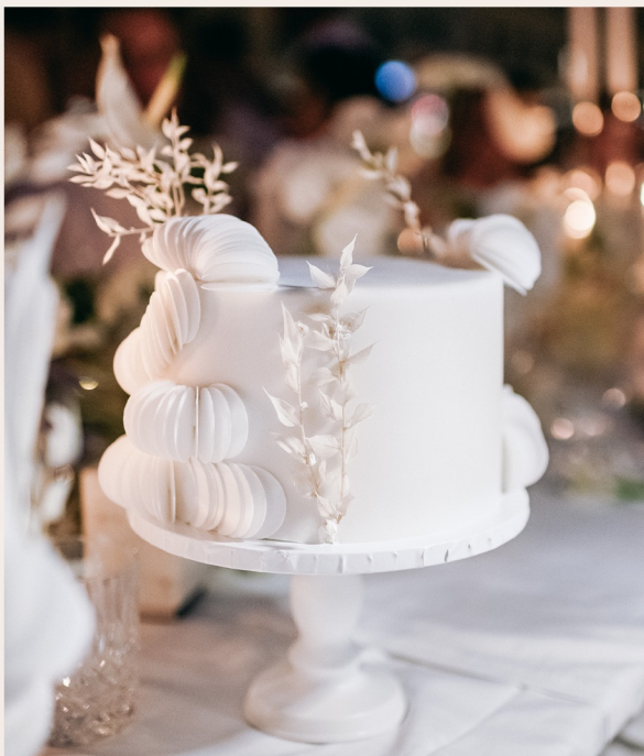
Beispieltorte: 8 Stück, Ø 15cm, Höhe ca. 12cm

1 STOCKWERK 2 STOCKWERKE WEITERES ab 125,00 € ab 289,00 € auf Anfrage