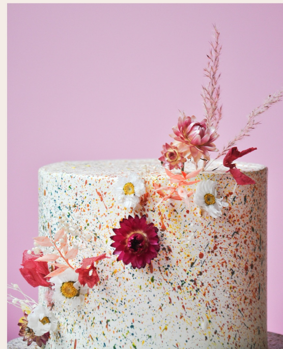
Beispieltorte: 8 Stück, Ø 15cm, Höhe ca. 12cm

1 STOCKWERK 2 STOCKWERKE WEITERES ab 113,00 € ab 268,00 € auf Anfrage