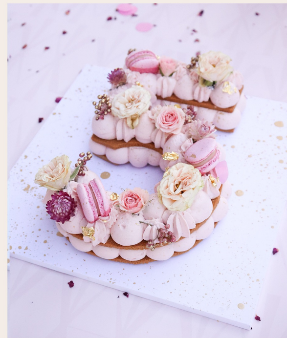
Lettercake beerig L/B/H ca. 30cm/20cm/8cm

ZAHL (0-9) WEITERES ab 139,00 € auf Anfrage