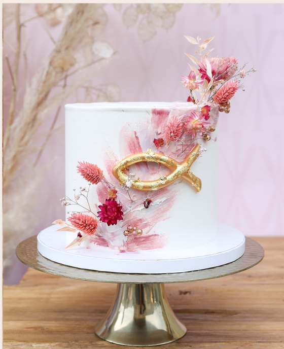
Beispieltorte: 8 Stück, Ø 15 cm, ca. 12cm Höhe

1 STOCKWERK 2 STOCKWERKE WEITERES ab 146,00 € ab 307,00 € auf Anfrage