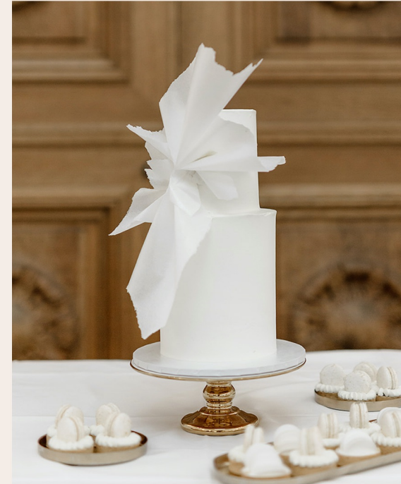
Beispieltorte: 30 Stück, Ø17cm, Ø13cm, ca. 25cm hoch