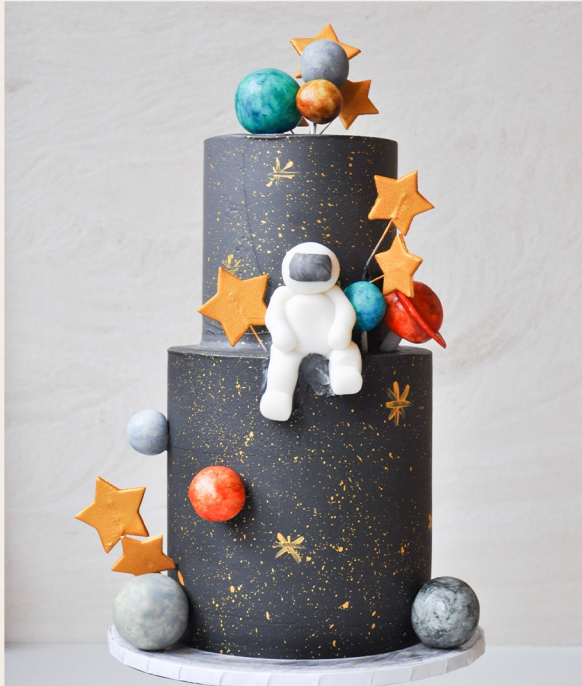
Beispieltorte: 30 Stück, Ø 17cm ,Ø 13cm

1 STOCKWERK 2 STOCKWERKE WEITERES ab 150,00 € ab 308,00 € auf Anfrage