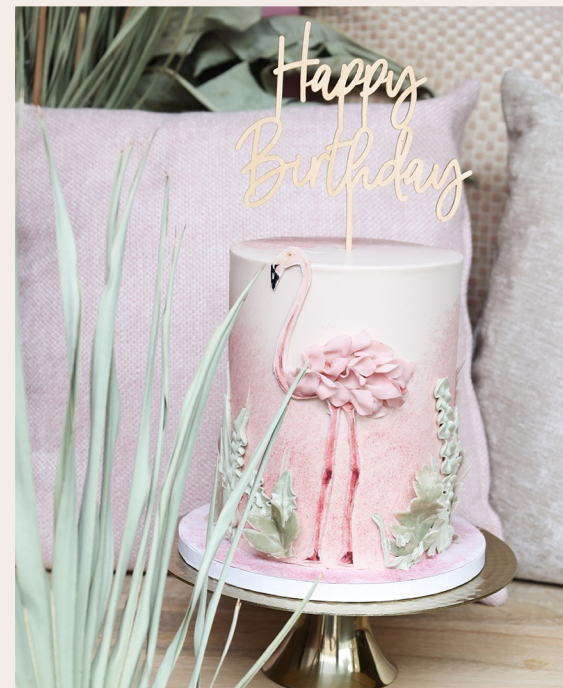
14 Stück, Ø 15 cm, ca. 18cm Höhe ohne Topper

1 STOCKWERK 2 STOCKWERKE WEITERES ab 139,00 € ab 294,00 € auf Anfrage