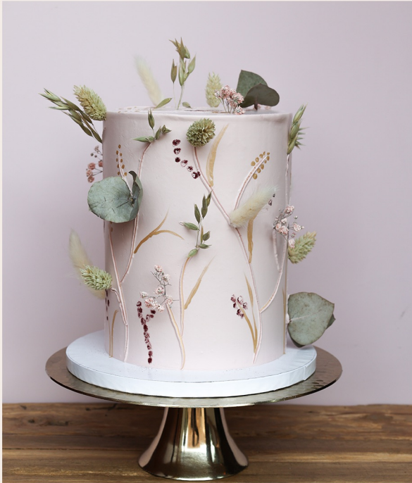
Beispieltorte: 14 Stück, Ø15cm, ca 18cm hoch