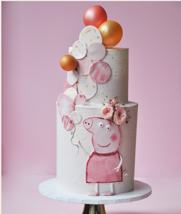
Beispieltorte: 30 Stück, Ø 17cm, Ø 13cm

1 STOCKWERK 2 STOCKWERKE WEITERES ab 138,00 € ab 296,00 € auf Anfrage