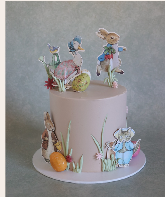
Beispieltorte: 14 Stück, Ø 15cm ca. 18cm Höhe

1 STOCKWERK 2 STOCKWERKE WEITERES ab 133,00 € ab 291,00 € auf Anfrage